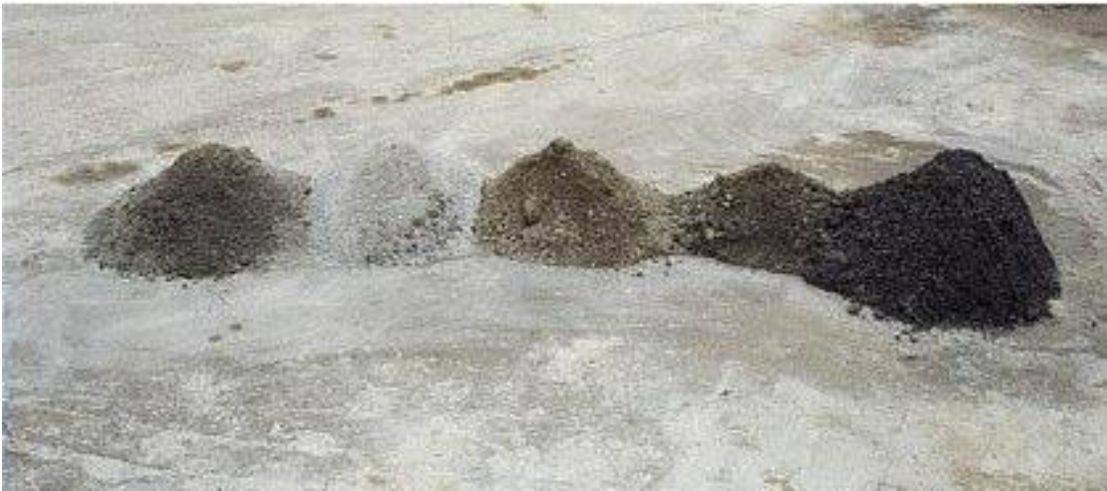
ekil 3. Konkasör tesisinden de i ik tarihlerde getirilen k,rma kum.

ekil 3ø de konkasör tesisinde de i ik tarihlerde üretilen k,rma kumlar,n bünyesindeki kil ve ta unu miktar,n,n art, ,ndan kaynaklanan renk farklı,l,klar, görülmektedir.