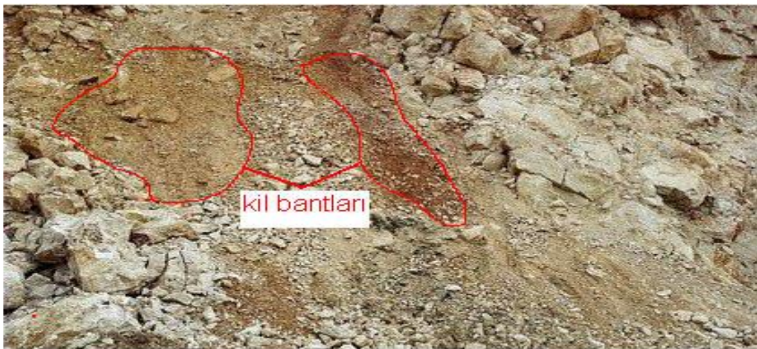
ekil 1. Kaya ocağındaki kil bantları,

ekil 2'de ise patlatma işlemi sonunda konkasöre taşınmak üzere hazır konumda bekletilen kaya parçaları arasında kil görülmektedir.