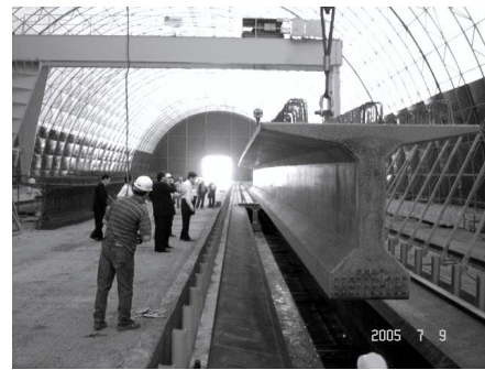
ekil 1,2. Üretim merkezinden görüntüler.